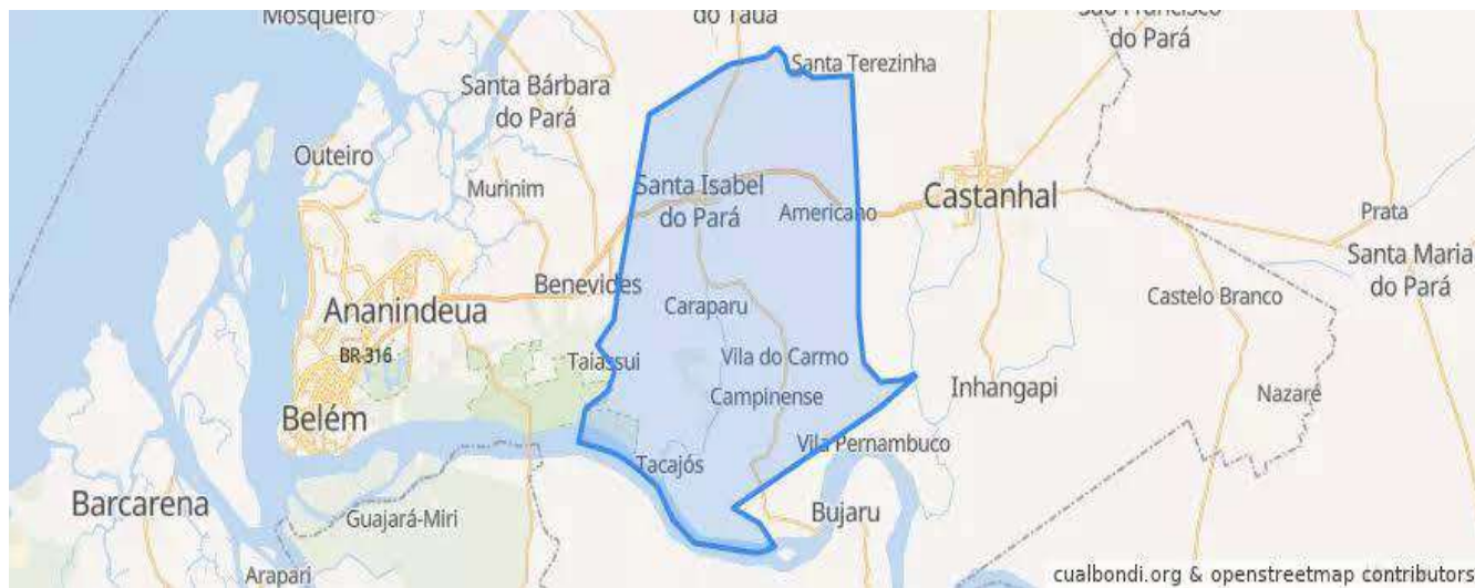
Figura 1 – Mapa da Sede do Município Santa Izabel do Pará-PA. (ano 2021).