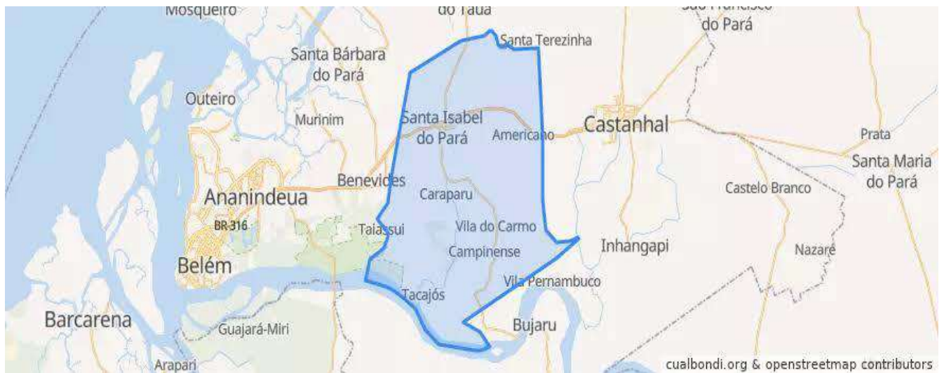
Figura 1 – Mapa da Sede do Município Santa Izabel do Pará-PA. (ano 2021).