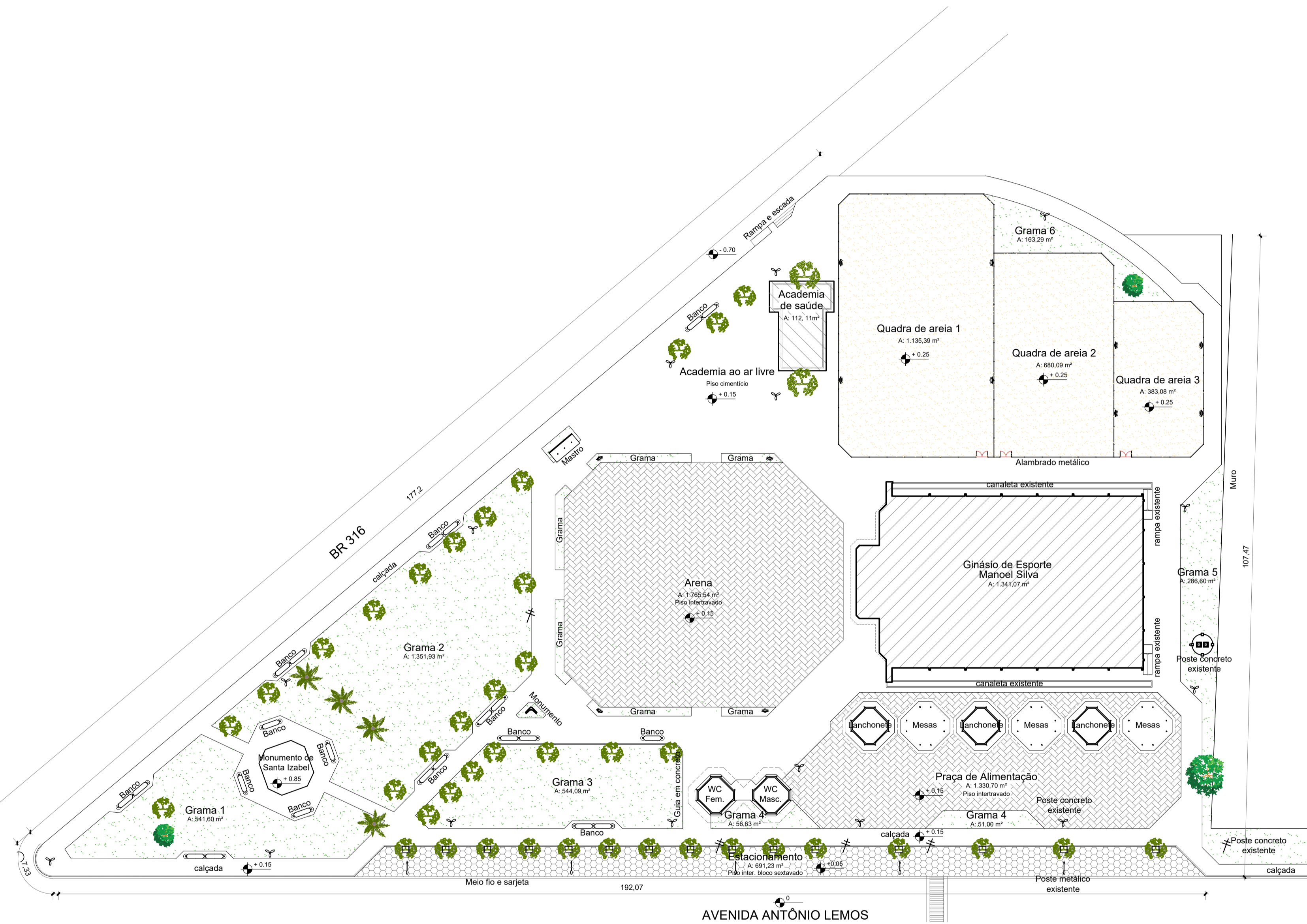
Planta Existente Escala 1/500

Obs: NBR 1272:2006 da ABNT (Associação Brasileira de Normas Técnicas) área construída é a área total coberta de uma edificação