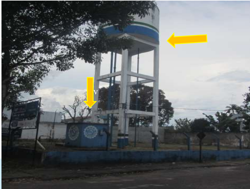
Foto 3: Vista pelo cruzamento da Av. Francisco Amâncio (frente) e Travessa Santa Izabel (pela lateral). Castelo D'água de 100m³ e abaixo em azul, casa de bomba e energia.

SERVIÇO AUTÔNOMO DE ÁGUA E ESGOTOS – S.A.A.E. Lei Municipal n.º 06, de 18 Janeiro de 1957. CNPJ: 05.696.125/0001-11