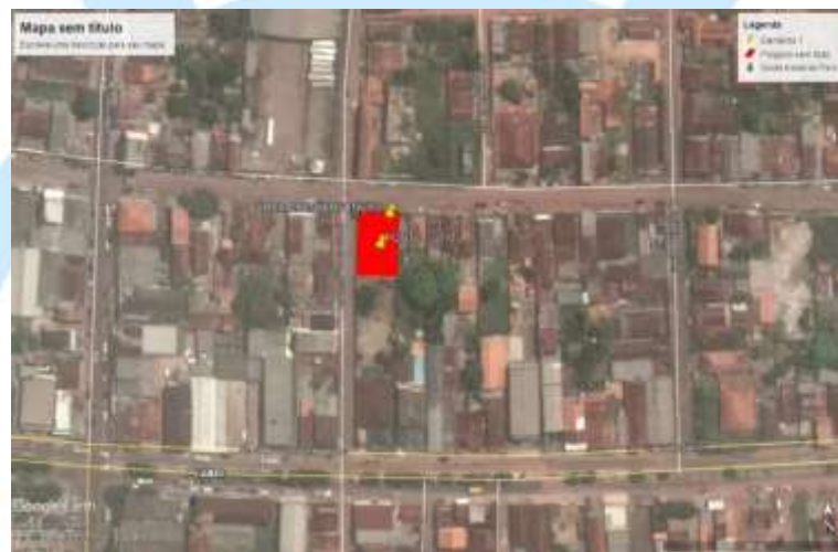
Imagem via Satélite 1: Localização.

As fotos exibidas neste relatório demonstram a condição atual da área e intervenção do terreno onde será executada a obra.