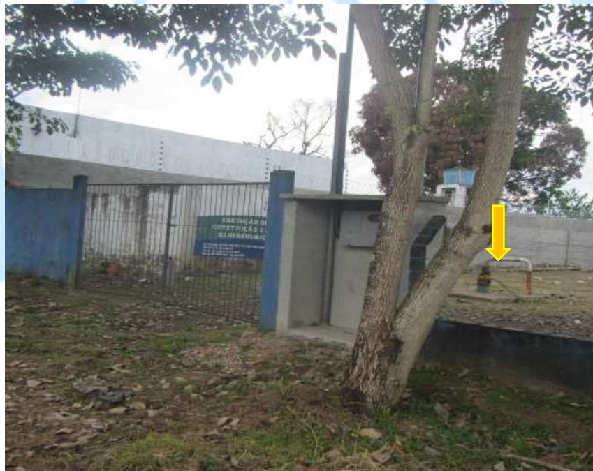
Foto 2: Vista da área de intervenção pela Av. Francisco Amâncio(frente), seta indicando poço existente.