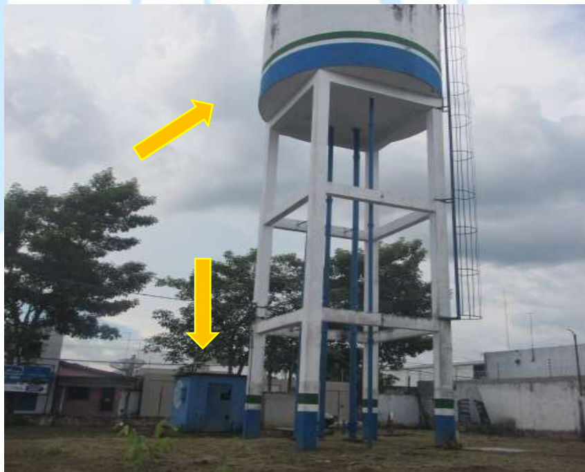
Foto 4: Vista pelo fundo do terreno do sistema de água. Castelo D'água de 100m³ e abaixo em azul, casa de bomba e energia.