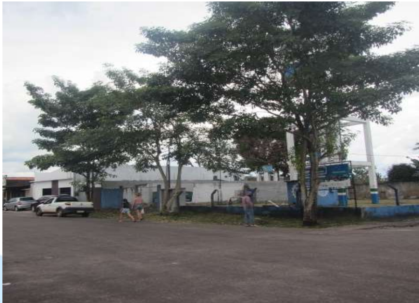
Foto 1: Vista da área de intervenção pela Av. Francisco Amâncio(frente)