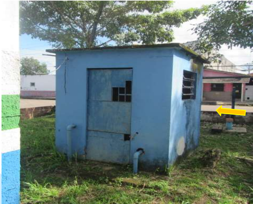
Foto 5: Vista de dentro do terreno do sistema de água. Castelo D'água de 100m 3 e abaixo em azul, casa de bomba e energia.

SERVIÇO AUTÔNOMO DE ÁGUA E ESGOTOS – S.A.A.E. Lei Municipal n.º 06, de 18 Janeiro de 1957. CNPJ: 05.696.125/0001-11